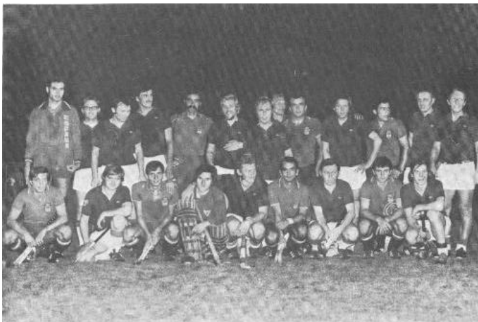
Olympiajahr 1972. Die spanische Nationalelf als Gast in Rosenheim.

Nach der Olympiade 1972 in München und der Goldmedaille durch die deutsche Hockeynationalmannschaft erhielt die Hockeyabteilung einen regen Zulauf an Jugendlichen, wodurch mehrere Jugend- und Knabenmannschaften am Nachwuchs - Spielbetrieb teilnehmen konnten, was die Platznot noch vergrößerte. Auch ein zeitweises Ausweichen auf Schulsportplätze bzw. auf den Sportplatz des Bundesgrenzschutzes konnten diese Misere nicht beheben.